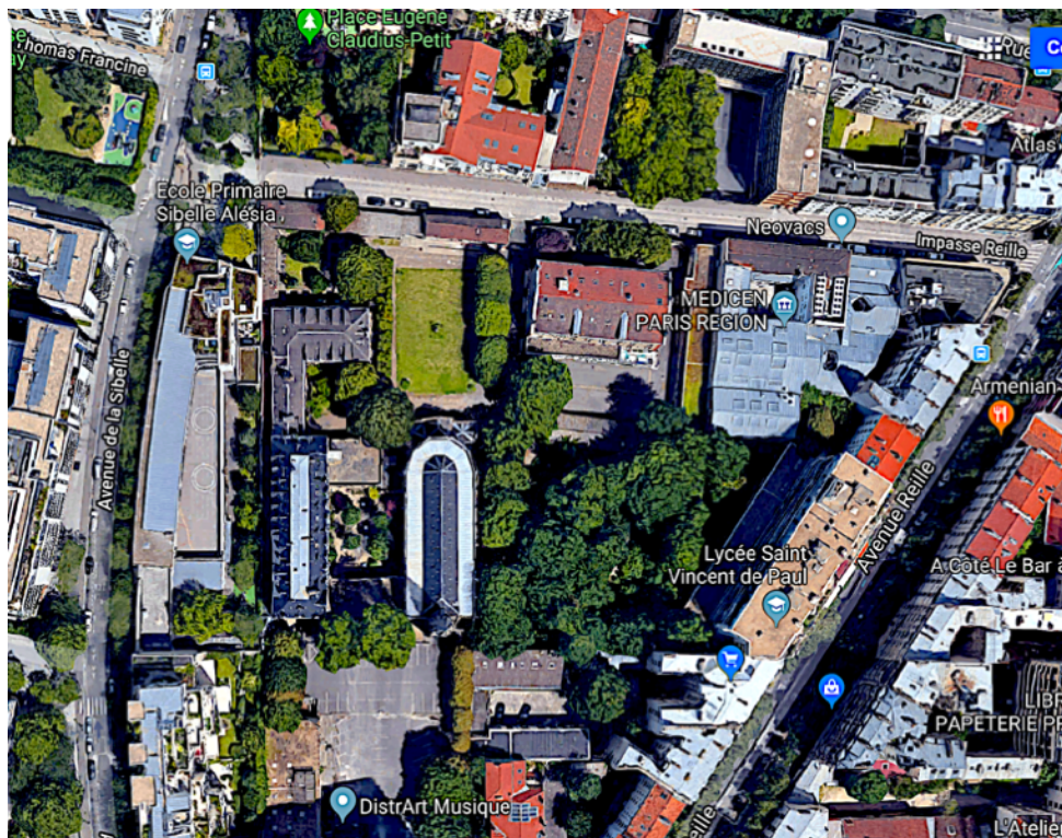
La propriété impasse Reille