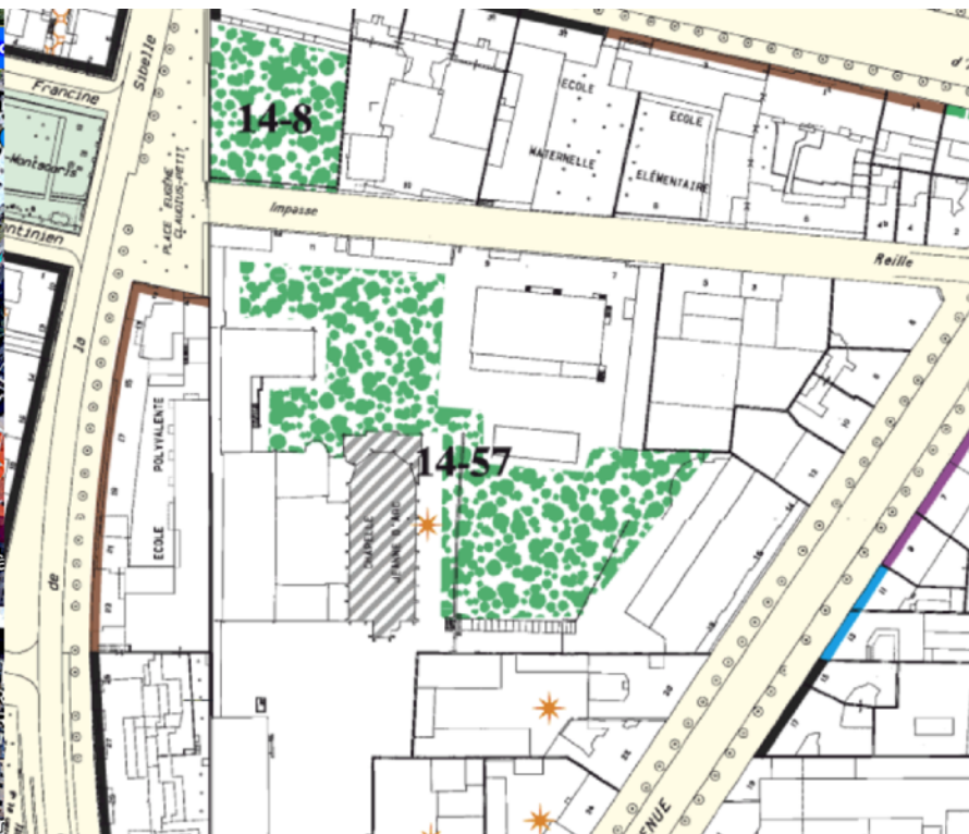
Le PLU: EVP et protection architecturale